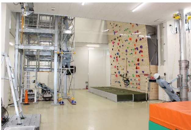
▲(株)トーエネックの安全教育施設「安全創造館」

当社では、従業員および協力会社が全員で「安全最優先」の意識を共有し、労働災害の未然防止に取り組んでいます。しかし、依然として繰り返し型の災害が多く発生しています。そこで、再発防止対策を徹底するとともに、「安全創造館」での安全教育などにより安全の知識・技術・意識を高め、災害の未然防止に向け、継続して取り組んでいきます。